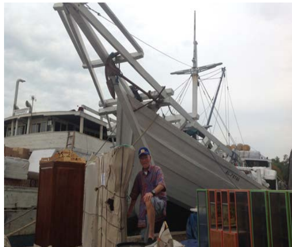
Oude pinisi haven in Surabaya