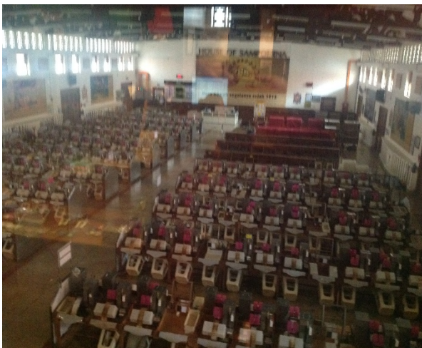
Sapoerma kretek fabriek