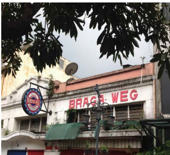
Entree Brega Weg

Na de Jalan Brega even het beroemde Savoy Homann (1921) en aan de overkant het hotel Preanger (1929) bekijken en het Gouverneurs Paleis.