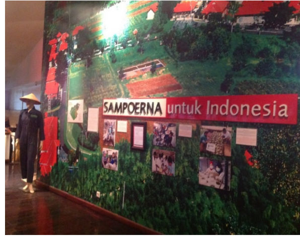
Het kretek Museum van Sapoerma

Na al die leuke ervaringen in Surabaya ( weer helemaal alleen ) zo'n 4 uur per trein naar Semarang langs de Noordkust naar het westen, weer midden Java dus.