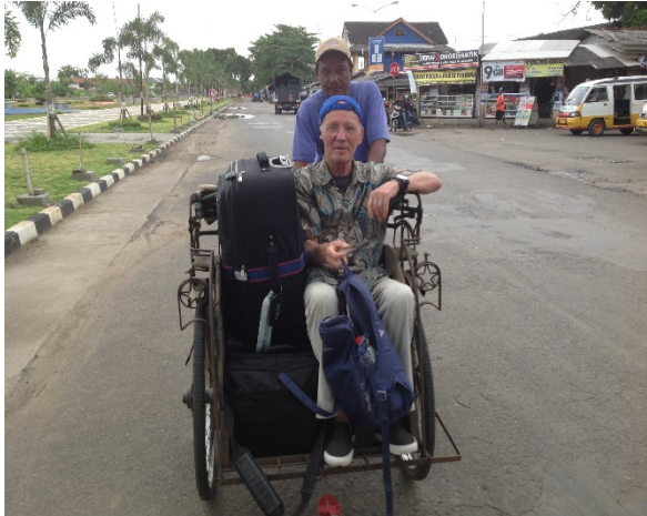
De Bedjah tocht