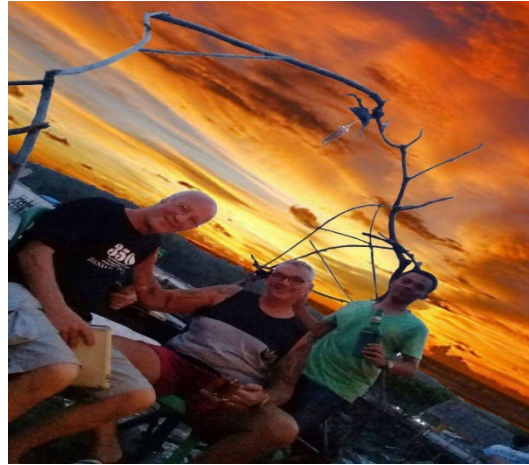
Warung Glory terras

Daar ontmoette ik in Warung Bistro Glory de chef eigenaar die als 20-jarige eens 6 maanden gesponsord is om naar Nederland te komen en bij van de Valk restaurants gewerkt heeft, nu inmiddels 45+ jaar, getrouwd met een live vrouw en een leuk zontje...en hij spreekt het Nederlands nog redelijk goed.