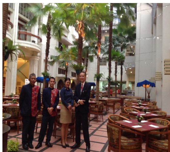
Hotel Savoy Homann

De laatste stop voordat ik weer terugvlieg vanuit Jakarta naar ons kikkerlandje eind november: