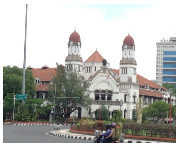
Na het Spoorwegmuseum bezoek even lekker sate kambing eten